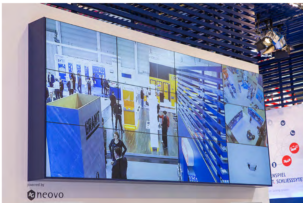
Auf der über 4,5 Meter hohen Videowand konnten die Messebesucher bereits von weithin sichtbar die gestochen scharfen Bilder der ABUS IP-Kameras bestaunen,