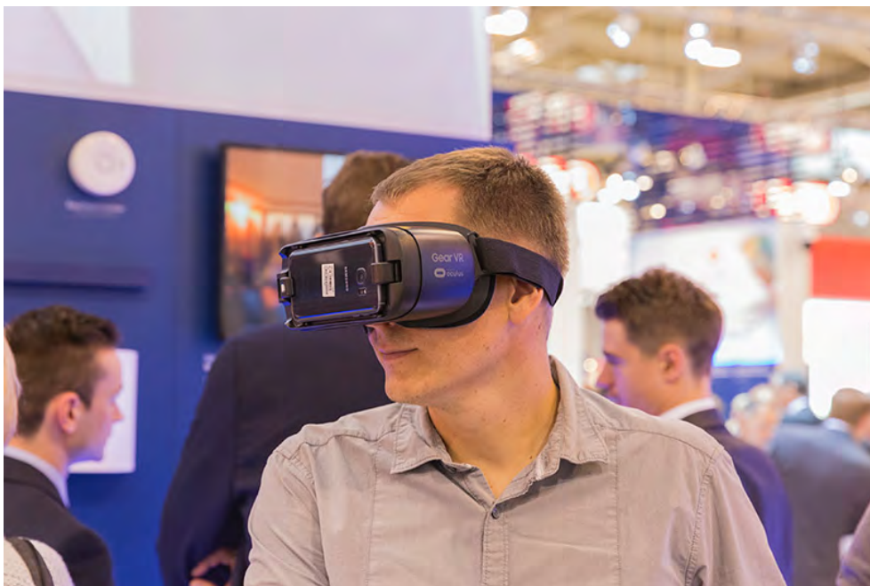
Mit Hilfe aktueller Virtual Reality-Anwendungen erhielten die Gäste auf dem ABUS Messestand Einblick in die Vision vernetzter Sicherheitstechnik im Jahr 2024